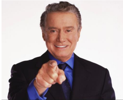
pitanje broj 87