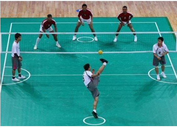
pitanje broj 77